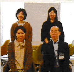
お話をうかがった 横浜市の職員のみなさん

今回の市民向け講演会は、告知から2日で満席になり、呼吸や呼吸筋ストレッチ体操への市民の関心の高さが示されました。